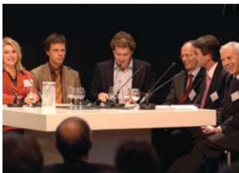
Verstedelijkingsopgave in het kader van groen en blauw