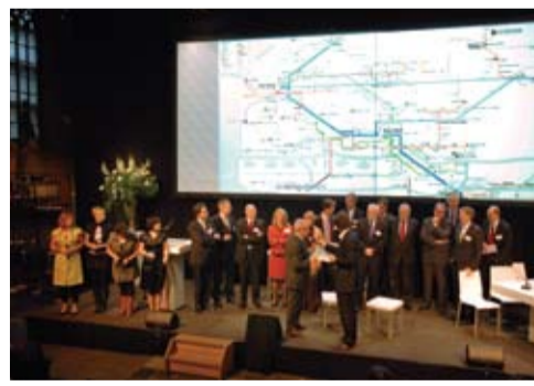
Presentatie van de lijnennetkaart voor het regionaal OV in de Zuidvleugel