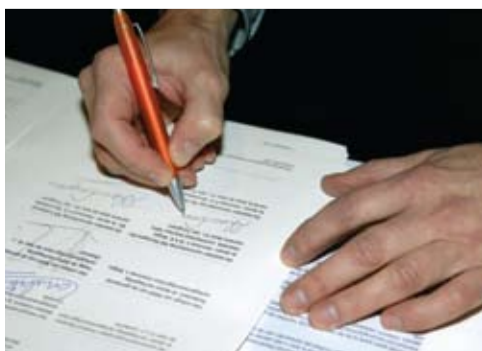
Ondertekening van de uitvoeringsovereenkomst