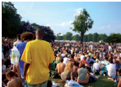
Parken als ontmoetingsplaats?

De Zuidvleugelpartners willen integrale verstedelijkingsafspraken maken met het rijk. Daarin moet ook een plek zijn voor het groen-blauw. Daarom moeten we goed weten over welke verbinding we het hebben. In de workshop wordt de vraag naar kwaliteit en bereikbaarheid verkend. Want wat wil de stedeling in de toekomst en hoe spelen we daar op in? Waar hebben we het over?