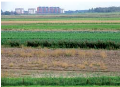
Het wijdse landschap, een blijvertje?