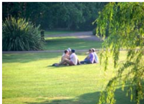
Het park als rustplek?