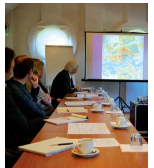
Presentatie door de heer Tummers

Hij ziet monumentale verschuivingen in het begrip openbare ruimte. Dit heeft te maken met het ontstaan van een nieuw soort stedeling: de metropolitane burger. Deze burger wordt gekenmerkt door een hogere mobiliteit, heeft een ander tijd/ruimte besef. Daarnaast noemt Van der Velde het belang van de inbreng van evenementen op de stadscultuur en stadsruimte. Als voorbeeld noemt hij Melbourne. De relatie met infrastructuur en 'eventcultuur' is er sterk. En door makkelijke verbindingen door goede infrastructuur is het groen buiten de stad snel bereikbaar waardoor het kan concurreren met andere stedelijke vrije tijdsbestedingen. In de Zuidvleugel zien we dat de relatie tussen groen en infrastructuur is verwaarloosd. Daar moeten we op inzetten!