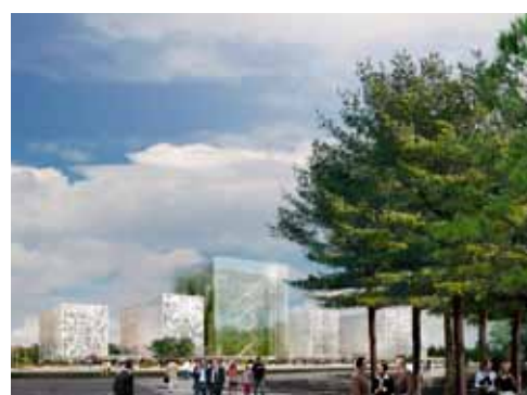
Vrede, Recht & Veiligheid