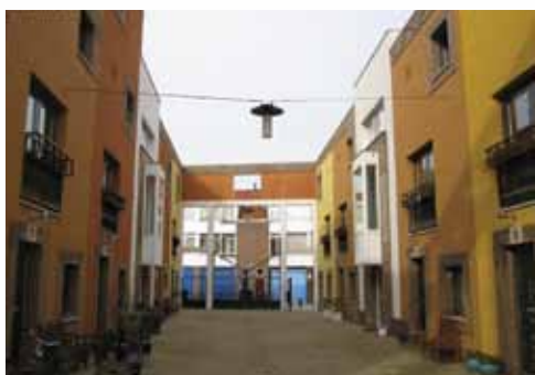
Le Medi, Rotterdam