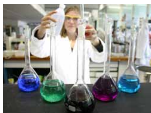
Life Sciences & Health

De portefeuillehouders economie in de Zuidvleugel hebben de handen ineen geslagen om gezamenlijk te werken aan de Economische Transitie Agenda voor de Zuidvleugel, op basis waarvan de zuidvleugelpartners met het bedrijfsleven en kennisinstellingen concrete afspraken maken om deze hindernissen gezamenlijk aan te pakken en kansrijke ontwikkelingen aan te jagen.