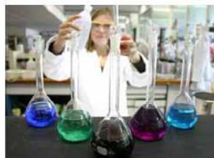
Life Sciences & Health