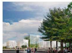
Vrede, Recht & Veiligheid